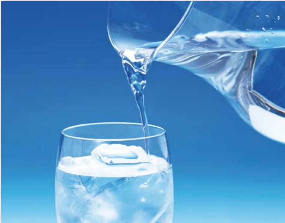
Es fundamental estar siempre bien hidratado.

E strenamos verano y altas temperaturas que, en ocasiones, superan los 40 grados. Y si como peatones tenemos que hidratarnos mucho y protegernos del sol, resguardándonos a la sombra, al volante también hay que extremar la precaución. Desde la empresa Sixt, recomiendan seguir una serie de pautas para que los golpes de calor no nos afecten mientras conducimos y disfrutamos de nuestras vacaciones.