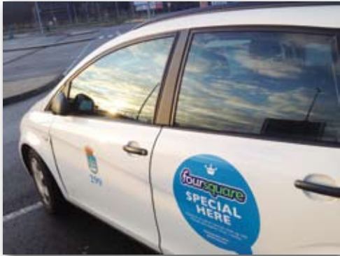
Si encuentra este taxi en Oviedo vivirá una experiencia diferente.

nales muy preparados y que somos gente normal. Quienes critican a los taxistas suelen ser este tipo de usuarios ocasionales, porque nuestros clientes habituales saben cómo es el taxi. No todos somos como presuponen.