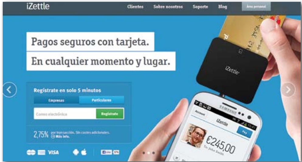
El pago es seguro, esté donde esté el profesional.

Además de este extra para sus clientes, este profesional del volante aprovecha las