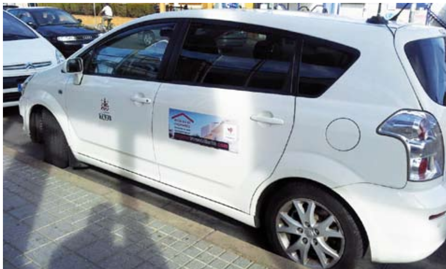
La publicidad exterior en el taxi ya es una realidad en muchas ciudades españolas.

Poder llevar publicidad interior y exterior es una de las peticiones que suelen estar presentes en todas las negociaciones entre sector y administración. Y en muchas ciudades ha habido entendimiento. León, Sevilla, Valencia o Zaragoza son algunas de las que ya cuentan con los ingresos extra que puede aportar la publicidad. Barcelona ha sido la última incorporación, mientras que Madrid queda como la gran perjudicada, al seguir impidiendo el Ayuntamiento que porte publicidad en su exterior.