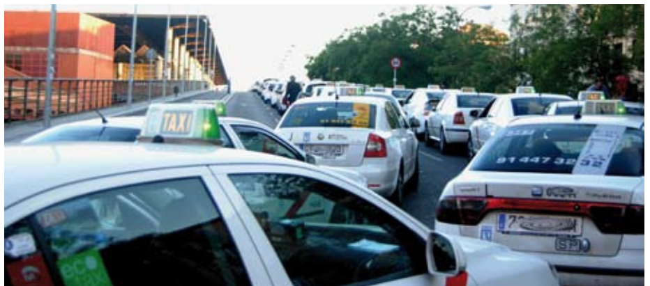
Atocha se ha convertido en un caballo de batalla para el taxi en los últimos meses.