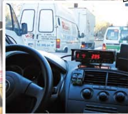
Se destapa el escándalo del subarriendo