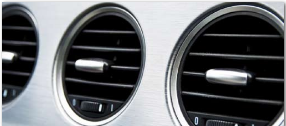
Una buena temperatura ayuda a mantener el confort durante la conducción.

8 Si tienes gafas de sol, úsalas. Prevenir deslumbramientos utilizando unas gafas de sol te ayudará a conducir con mayor seguridad cuando lo hagas con el sol de cara. Si utilizas gafas de visión, es aconsejable que te hagas con unas gafas de sol graduadas. Tus ojos también lo agradecerán.