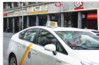
Los titulares de las licencias retiradas recibirán 68.685,40 euros

L a intención del Instituto del Taxi es terminar el año con 78 licencias rescatadas. Además, se ha aprobado una subvención de 150.000 euros para modernizar el sector. La propuesta de rescate de 40 licencias más durante este año fue aprobada en Consejo de Gobierno y será llevado próximamente a Junta de Gobierno. El actual gobierno local recordó que en 2011 se comprometió a retirar 154 licencias durante su mandato y que, de momento, está cumpliendo los plazos. Además, el acuerdo incluye también una nueva revisión del mismo en el 2015. Los titulares de las licencias retiradas recibirán 68.685,40 euros en concepto de subvención plurianual en tres pagos. Por otro lado, también se ha aprobado una subvención de 150.000 € para modernización del taxi. Se espera actualizar tecnológicamente la flota con módulos multitarifarios, impresoras de recibos, etc. La intención, explican desde la administración, es dotar de mayor seguridad el servicio para cliente y profesional.