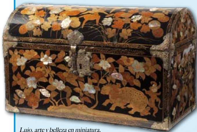
Lujo, arte y belleza en miniatura.

A través de sus diferentes piezas se entiende el primer contacto del reino español con la cultura japonesa en la etapa conocida como periodo Namban (1543-1639) y descubrir las interesantes huellas que dejó este periodo en España. En la primera parte se explica la finalidad de esta embajada, su trasfondo histórico y la relación diplomática entre ambos países mediante documentos y objetos históricos. La segunda parte está dedicada a las obras de laca japonesa de estilo Namban conservadas en España, una mercancía de lujo que viajaba de Japón a España en los siglos XVI y XVII. Por primera vez, se reúnen un considerable número de obras de laca Namban celosamente guardadas en monasterios, conventos, capillas e iglesias de toda España. Museo Nacional Artes Decorativas. c/ Montalbán, 12. Hasta el 29 de septiembre.