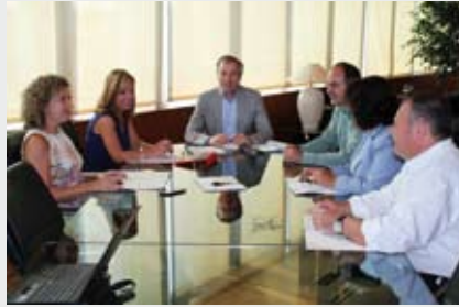
Esperan combatir la proliferación de piratas en la isla.