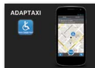
Adaptaxi está disponible para sistemas Android e iOS y su descarga es gratuita.

R adioteléfono Taxi ofrece a sus clientes una nueva aplicación para pedir taxi adaptado. Ya sea para quienes se desplazan en silla de rueda, lleven niños mucho que llevar, todos pueden solicitar este tipo de vehículos. A través de Adaptaxi, los clientes habituales de RTT podrán solicitar además servicios adicionales, como pago con tarjeta de crédito, que sólo tendrán que configurar en las opciones de la aplicación. Desde el año 1989 Radioteléfono Taxi cuenta con taxis adaptados para personas con movilidad reducida. Recuerdan que gran parte de los eurotaxis incorporan silla homologada para niños