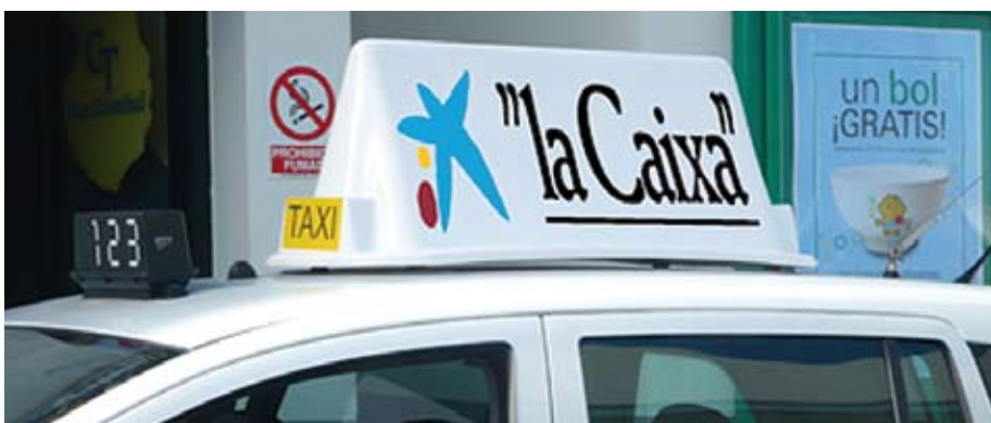
El soporte de techo, la opción más visible.

lo de algo más de un metro que muestra avisos ofertas con capacidad para seis anuncios. El modelo tiene capacidad para seis anuncios (tres por cada lateral, que va rotando cada pocos segundos), lo que permitiría multiplicar los ingresos por anunciante.