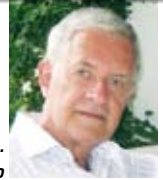
Germán Ubillos. Premio Nacional de Teatro