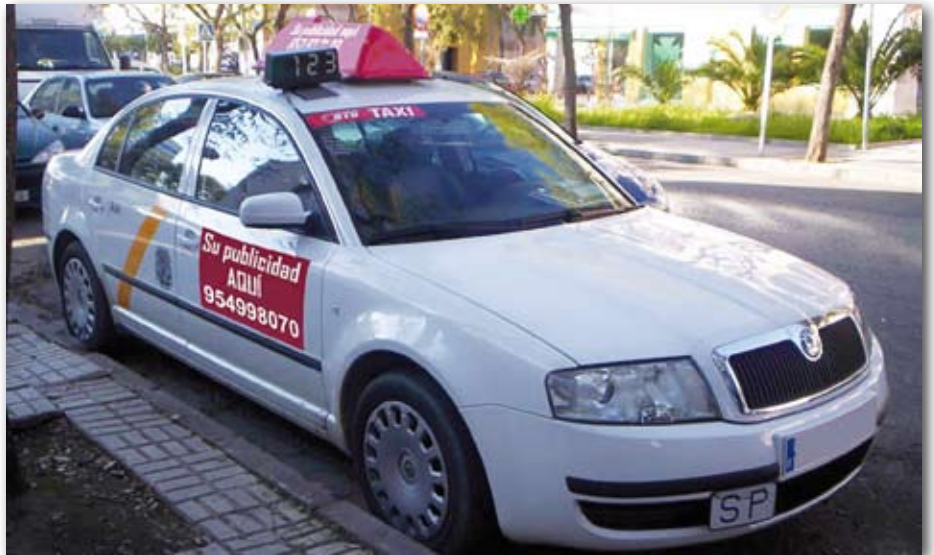
Los profesionales saben muy bien qué ofrecer a sus posibles anunciantes.

Aunque la opción de la publicidad en el taxi no es una práctica habitual entre los