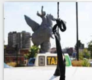
Una vez más, el taxi muestra su lado más solidario

Asimismo, la Confederación ha requerido a todas las administraciones a que pongan "todo su empeño" para averiguar lo sucedido y que se dispongan de todos los medios para que accidentes de ese tipo no vuelvan a ocurrir.