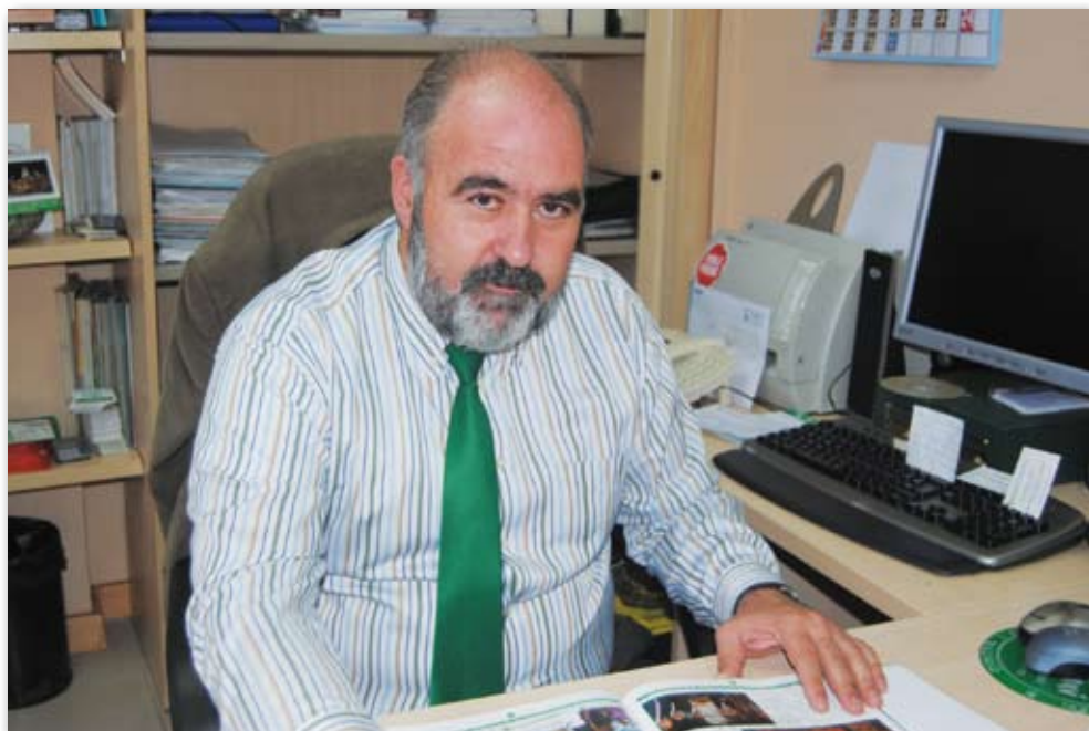
Federación y Gremial se han reconocido mutuamente la representatividad.

M.S.- Desde la Federación hemos realizado un meticuloso estudio sobre cómo actúa el taxi en la estación Atocha y cómo se presta el servicio en las horas de mayor demanda. La principal conclusión es