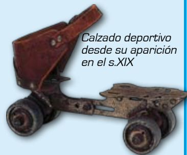
Calzado deportivo desde su aparición en el s.XIX

El calzado deportivo, su evolución y especialización centran el interés de esta exposición organizada por el Museo del Calzado de Elda. Con la popularización del deporte en el siglo XIX, los diseñadores idearon un calzado anatómico que facilitara los movimientos durante el ejercicio. Desde su antecedente más antiguo, la zapatilla de tela blanca con suela de goma hasta hoy se ha hecho un largo recorrido hasta crear un calzado específico para casi todo: patinar, boxear, jugar al fútbol, baloncesto o a tenis. Podemos ver desde las zapatillas con las que jugó Rafael Nadal la final de Wimbledon de 2007 hasta botas de buzo, pasando por el calzado usado para las regatas o los botines de cricket, en esta exposición se recoge una selección de los distintos calzados utilizados para la práctica del deporte a lo largo de la historia. Lo más curioso del calzado deportivo es que hoy es además un complemento de moda y de uso habitual en todos los estratos sociales. Museo del Traje. Av. de Juan de Herrera, 2. Hasta 22 de septiembre