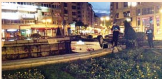
El espectacular accidente envió a dos taxistas al hospital.