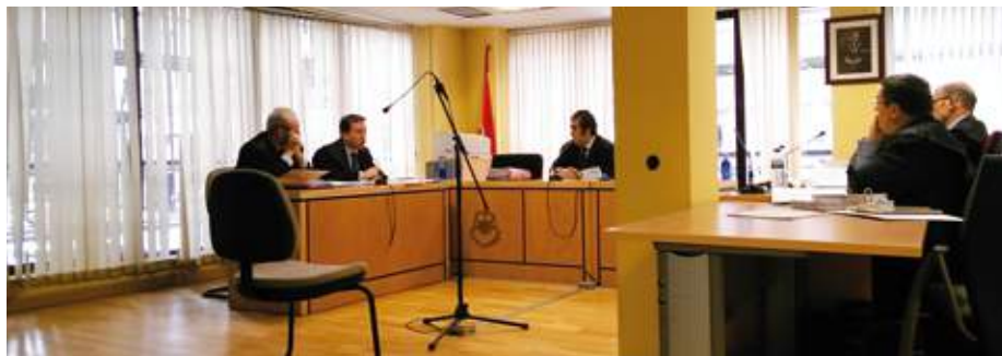
Imagen de la primera vista, el 26 de febrero.