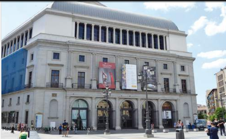
Madrid rebasó en 2014 varias veces el límite de contaminación.

En cuanto a vehículos que no sean de combustión interna (eléctricos, de pila de combustible o de emisiones directas nulas), los vehículos híbridos enchufables y