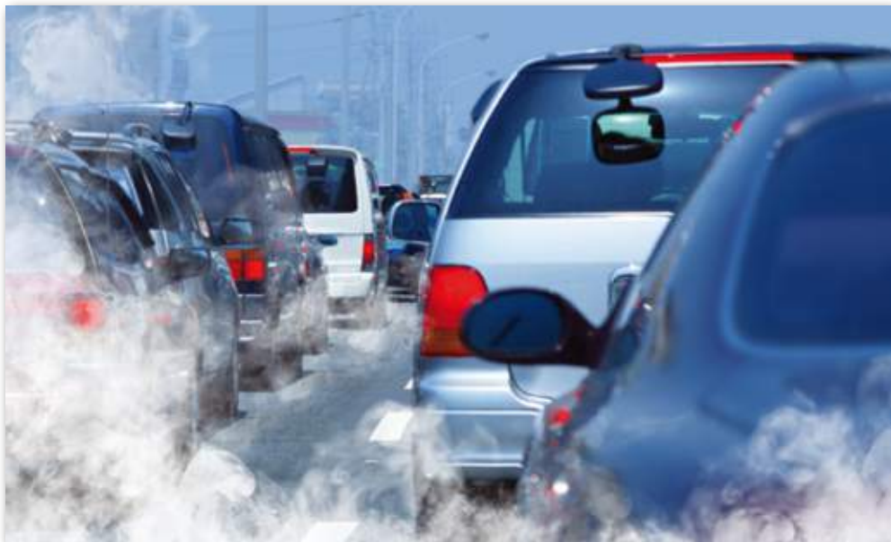
Madrid rebasó en 2014 varias veces el límite de contaminación.

Desde el 1 de marzo el protocolo para episodios de alta contaminación por dióxido de nitrógeno (NO 2 ) está actualizado en Madrid. En el caso tres días de alerta, contempla restricciones de tráfico en la almendra central, con la prohibición del estacionamiento de coches no residentes o la restricción del acceso de tráfico rodado al 50%. Además, limita la velocidad a 70 km/h en la M-30, principal vía de circunvalación de la ciudad, y en los principales accesos a la capital (a partir de la M-40).