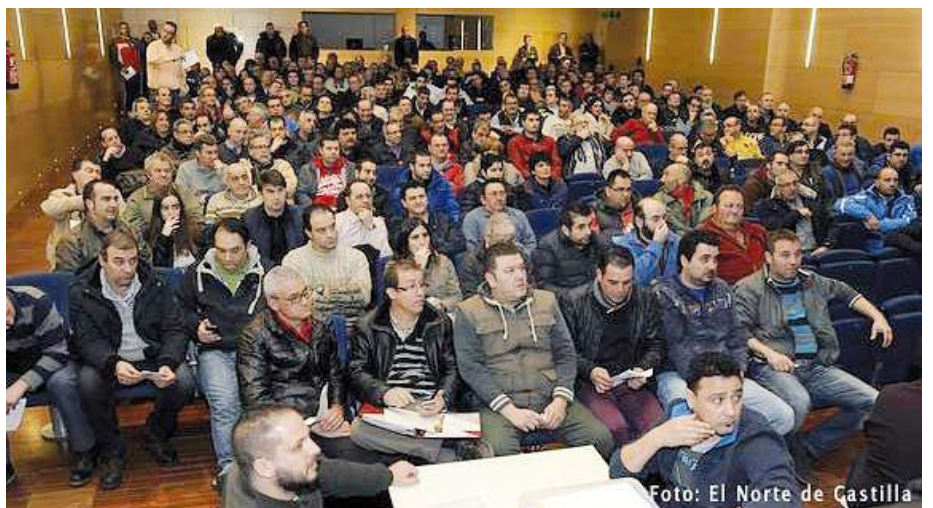
Imagen de una de las últimas asambleas extraordinarias.

han sido que la confianza de la misma ha quedado fuertemente mermada, haciéndoles dudar sobre presentarse o no a la renovación de sus cargos en mayo. Aseguran que tienen los ánimos por los suelos y “muy pocas ganas” de seguir al frente al haber recibido el “descrédito” y “ataques personales” de compañeros de profesión. Lo achaca a que quizás es por