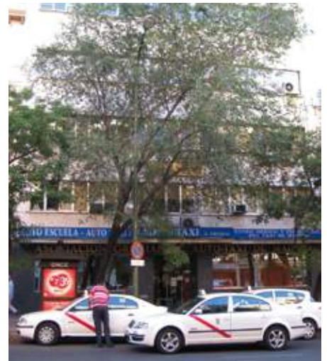
Fachada de la asociación Gremial, en Madrid.

L a Federación de Asociaciones de Personas con Discapacidad Física y Orgánica de la Comunidad de Madrid (FAMMACocemfe Madrid) denunciaba a Radio Taxi Gremial por publicidad "engañosa y discriminatoria" hacia las personas con discapacidad y/o movilidad reducida en la campaña recogida clientes a coste cero. FAMMA explicaba en nota de prensa que esta campaña sólo se aplica en servicios de taxi convencional, "no de taxi adaptado". Una cuestión "totalmente discriminatoria" porque los usuarios de eurotaxi deben abonar el coste, 5 euros en zona A y 8 en zona B". Además, consideraban un "reclamo engañoso" hablar de coste cero cuando en la práctica el cliente debe abonar en el momento de subirse al taxi un mínimo de 2,40 euros". Añadieron desde FAMMA que "tampoco favorece la integración del colectivo que la aplicación para contratar servicios de forma telemática de esta radioemisora, "Taxi ya!", no permita contratar servicios de taxi adaptado". Por todo ello, la Federación cursó denuncia ante la OMIC para "hacer valer los derechos de las personas con discapacidad y que no se discrimine a las personas, en la práctica, por razón de discapacidad".