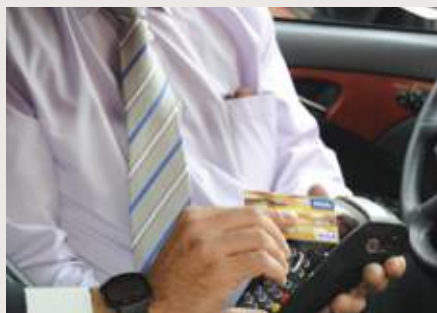
El banco ofrecerá al taxista ventajas como líneas especiales de crédito.

Otras de las cuestiones que se trataron en la reunión fue la opinión de este colectivo profesional en ciertas cuestiones de las infraestructuras de la ciudad. Se conversó acerca de la peatonaliza-