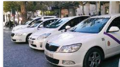
La provincia dispone de 300 licencias.