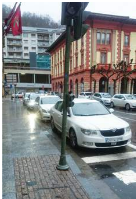
Parada de taxis de Eibar.

E.F.- Las zonas costeras o de la capital, San Sebastián. Cuanta más población hay más habitual es ver estas prácticas. Los