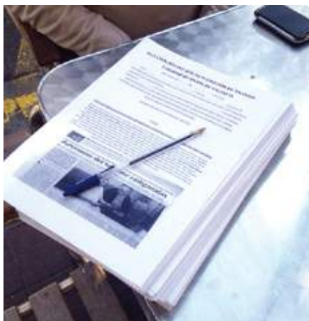
Autónomos unidos ha presentado 400 firmas para exigir más controles.

El problema es que socialmente está metido en la cabeza del taxista como algo normal alquilar una licencia, porque toda la vida le han dicho que existe. Pero es una ilegalidad. Nosotros intentamos erradicar esto de la mente de los compañeros porque ni es normal ni legal, incluso hay compañeros que lo justifican por la poca paga que nos queda cuando nos jubilamos. Aquí hay una corriente en contra de todo esto, estamos a favor de un servicio legal que trae consigo la calidad. Y debería ser lo