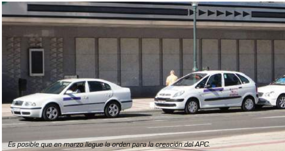
Es posible que en marzo llegue la orden para la creación del APC.

R.M.- Lo estoy valorando, tanto yo como mi grupo, pero la verdad es que me quedan muy pocas ganas. Podríamos estar hablando de una reestructuración completa de la Directiva. Tengo demasiadas batallas a la espalda y demasiado descrédito personal. Ha sido un ataque frontal contra mi persona, pues en todas las informaciones no aparece la Junta Directiva o el Consejo Rector. Es un ataque por envidia o malos entendidos, quizás. Llevo muchos años metido en tema de directivas y la verdad es que te vas creando muchos enemigos. Pero la verdad es que con todo esto se ha hecho flaco favor a la Cooperativa de Valladolid.