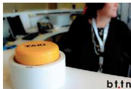
La empresa que ha puesto en funcionamiento el servicio es Les Taxis Bleus.

El principal operador de radio taxi de Francia, Les Taxis Bleus, lanza un servicio de "conserjería" que permitirá pedir un taxi en restaurantes, hoteles y tiendas a través de un botón. Gracias a un acuerdo con la empresa tecnológica BTTN, sólo pulsando este botón se podrá solicitar un taxi en cualquiera de los establecimientos antes mencionados, enviando una orden de recogida que será