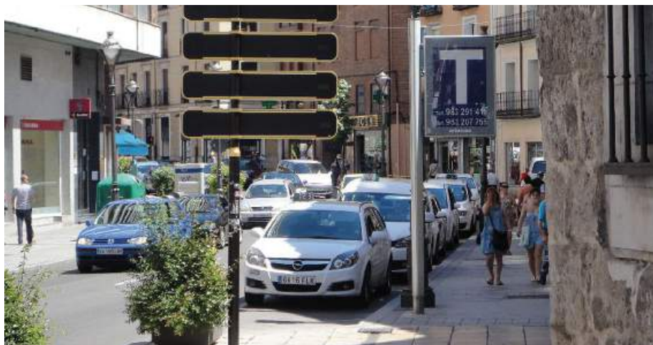
Parada de taxis en el centro de la ciudad.