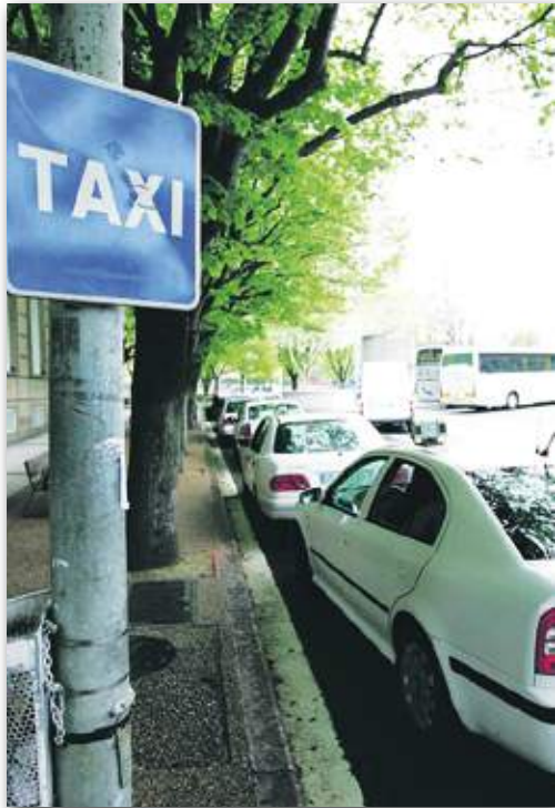
San Sebastián dispone de 385 taxis..

E.F. La normativa dice que podemos ir a recoger a cualquier punto del País Vasco siempre y cuando la persona a la que recogamos sea del municipio al que pertenece la licencia. Siempre rellenando los datos correspondientes del libro de ruta. Pero el destino no tiene porqué ser necesariamente ese municipio.