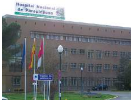
El Hospital de Parapléjicos de Toledo es referente nacional para el tratamiento de lesiones medulares.