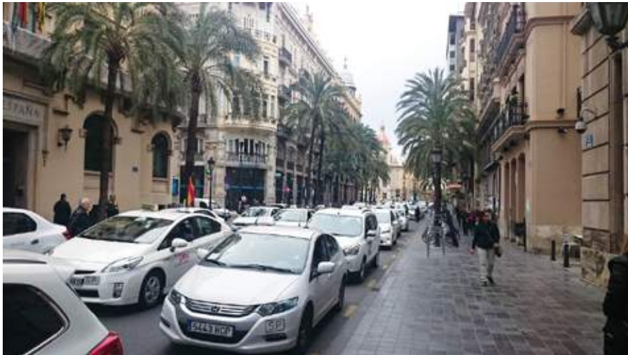
Cientos de taxistas protestan en Valencia.

E l pasado 25 de febrero Valencia se convirtió en el epicentro de la lucha del taxi contra la corrupción y el intrusismo. Cientos de profesionales, algunos de ellos llegados de otros puntos del país, acudieron a una cita en la que alzaron la voz contra una práctica cada vez más arraigada en el sector, el alquiler de licencias y demandaron más controles a la administración. Y parece ser que el “ruido” hizo efecto y sólo unas horas después de la manifestación la Policía Local comenzaba a realizar las primeras inspecciones a taxis para controlar que todo estaba en regla.