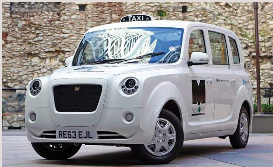
Las primeras unidades de Metrocabs eléctricos ya trabajan en la capital inglesa.

Los míticos taxis de Londres, de inspiración centenaria, en su versión más avanzada del siglo XXI, se han convertido también en cien por cien eléctricos. Frazer-Nash Research and Ecotive, fabricante del actual modelo Metrocab, (inspirado en el emblemático London Taxi) lograba poner en circulación su primer taxi eléctrico con cero emisiones, con capacidad para circular por cualquier área metropolitana del mundo. Las primeras unidades Metrocabs eléctricos (Metrocab's Range-Extended-Electric REE) ya han empezado a trabajar por las calles de Londres después de haber obtenido la autorización del organismo competente en materia de transporte. El fabricante explicaba que el nuevo coche está pensado para las necesidades diarias de los londinenses, y su diseño se inspira en el lujo Bentley, aunque mantiene las proporciones de los clásicos taxis negros, con capacidad para seis ocupantes.