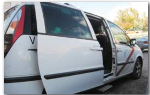
Los eurotaxis trabajarán todos los días.

“Nos negamos en todos los conceptos para que se cambien los días de libranza,