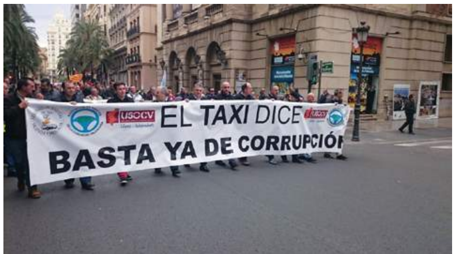
Salamanca también padece este problema.

Tal y como explican varios profesionales consultados por este medio, uno de los principales problemas a los que se enfrentan aquellos que luchan desde dentro contra esta competencia “desleal” es que esta práctica es algo “normal”, una solución de futuro con la que cuentan muchos próximos a jubilarse y que no ven como un problema. No renuncian al 100% de la pensión dándose de alta en la Seguridad Social, lo que implicaría perder la mitad de su pensión de jubilación pero que les permitiría realizar esta actividad de manera legal. Algo que no se hace y que, según aseguran, tampoco se persigue desde la administración. Aunque son hechos de-