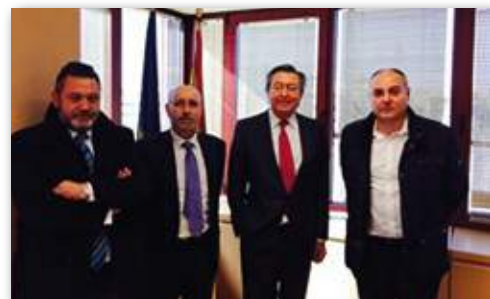
Imagen de la primera de las reuniones en busca de apoyos.

CITE, FEDETAXI y UNALT han mantenido en las últimas semanas una intensa agenda de reuniones con diferentes políticos tanto a nivel nacional como europeo. A todos ellos les han solicitado su apoyo para frenar las "aspiraciones de regularización" de aplicaciones "ilegales" como Uber. La ronda de conversaciones comenzó con el eurodiputado popular Luis De Grandes que trasladó a las tres asociaciones "una clara voluntad política" para que estas aplicaciones se sometan "tanto a la legislación europea como a la estatal". Una semana después mantenían otra reunión con Enrique Calvet, eurodiputado de UPyD y del grupo liberal en el parlamento europeo, quien manifestaba su indudable posición de que estas aplicaciones se sometan en todo caso tanto a la legislación europea como a la estatal. A nivel nacional las organizaciones nacionales han trasladado a Podemos, concretamente a su responsable de Relaciones con la Sociedad Civil, Rafael Mayoral, quienes comparten el rechazo a la incursión de empresas transnacionales que "bajo el paraguas de la economía colaborativa pueden precarizar y amenazar un sector que da empleo a unas 100.000 familias en España".