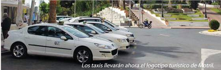
Los taxis llevarán ahora el logotipo turístico de Motril.