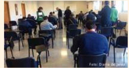
Los taxistas deben aprobar para seguir ejerciendo la profesión.

L os taxistas de Jerez se sometieron por primera vez a una prueba para demostrar todo lo que saben del oficio. Asalariados y titulares de licencia se presentaron a un examen obligatorio que deben aprobar para poder seguir ejerciendo su profesión. En caso de suspenderlo podrían perder la licencia. No obstante, para los que fallaron la primera prueba, habrá un segundo intento en un test de recuperación. La Asociación Teletaxi de Jerez, manifestaba a periódicos locales que "la acogida a la prueba ha sido positiva por parte de los profesionales", y que la mayoría de preguntas eran sencillas y conocidas por todos ellos. Las preguntas (40) se dividieron en tres bloques y quizás el primero (el más teórico) es el más complicado. La segunda parte se basaba en 16 cuestiones sobre lugares de interés de Jerez y, para terminar, se entregaron a cada taxista cuatro planos en los que se habían señalado dos puntos, A y B, solicitándose al profesional que trazara las rutas más cortas para llegar a destino.