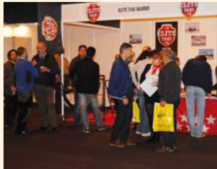
Élite Madrid, durante la última Feria del Taxi.

L a Asociación Élite Taxi de Madrid, AETM, a través de un comunicado, desmintió todas las acusaciones realizadas en el anterior número de La Gaceta del Taxi por la Asociación TACAM. Unas manifestaciones que han calificado como "rotundamente falsas". En el escrito remitido a los medios, negaban haber agredido físicamente a ningún taxista y les invitaban a presentar denuncias al respecto. "No somos violentos, sólo exigimos que se cumpla la legalidad". En la nota de prensa, Élite desmentían que bajen a ningún cliente de los taxis de fuera del APC y afirmaban seguir "protocolos de actuación muy claros", llamando a las autoridades pertinentes cuando detectan alguna "ilegalidad." "Si los taxis del fuera del APC de Madrid incumplen la normativa vigente recogiendo fuera del APC, queremos que se tomen las medidas oportunas", alegaban al respecto. En relación al cruce de vehículos en ciertas calles, señalaron desde AETM que "jamás" ponen en peligro ni a conductores ni usuarios, del mismo modo que no recogen a los clientes que son desmontados de estos vehículos, sino que se les acompaña a la parada oficial correspondiente. Para Élite es "aberrante" que los taxistas de fuera del APC desconozcan las leyes que afectan a la prestación del servicio, puesto que el Reglamento actual vigente es del año 2005. "Es su obligación" subrayaban, "conocer la normati-