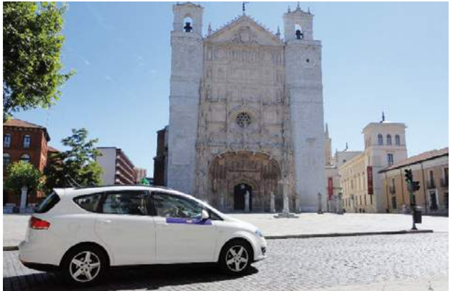
El sector celebrará elecciones en mayo.