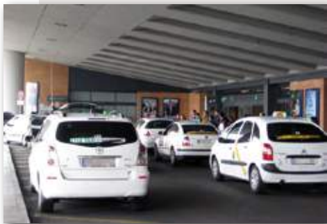
Taxistas y autobuses piden más policía en la estación de autobuses.

La convivencia entre conductores de autobuses del Tussam y taxistas en el aeródromo se volvía a tornar en insostenible. Las dos partes pidieron más presencia permanente policial ante los últimos incidentes ocurridos, en los que supuestamente un autobús fue atacado. La rotura del retrovisor y un faro en un autobús el pasado 10 de febrero era el desencadenante para que los empleados de este medio de transporte amenazaran con dejar de hacer el servicio si hay más riesgos. La grabación quedó en manos de la policía y se encontraba en investigación. Para el taxi este hecho se trataba de "algo puntual" y aislado. Si bien también compartían con los autobuses que una presencia mayor de la policía en San Pablo evitaría estos conflictos, creían que la conducción de algunos conductores de autobús era bastante peligrosa y que incluso ponía en riesgo a los taxis y sus conductores. La propia Asociación Solidaridad del Taxi ratificaba estos hechos, a la vez que aseguraba que la relación con los conductores de autobús venía siendo buena últimamente, pero dejaba entrever el malestar de los taxistas con la forma de conducir de este otro colectivo dentro del recinto. La administración contestaba a estos colectivos. La delegación de Movilidad y Seguridad del Ayuntamiento negaba que no existiera casi presencia policial y mantenía que la vigilancia de la Policía Local y Nacional es constante.