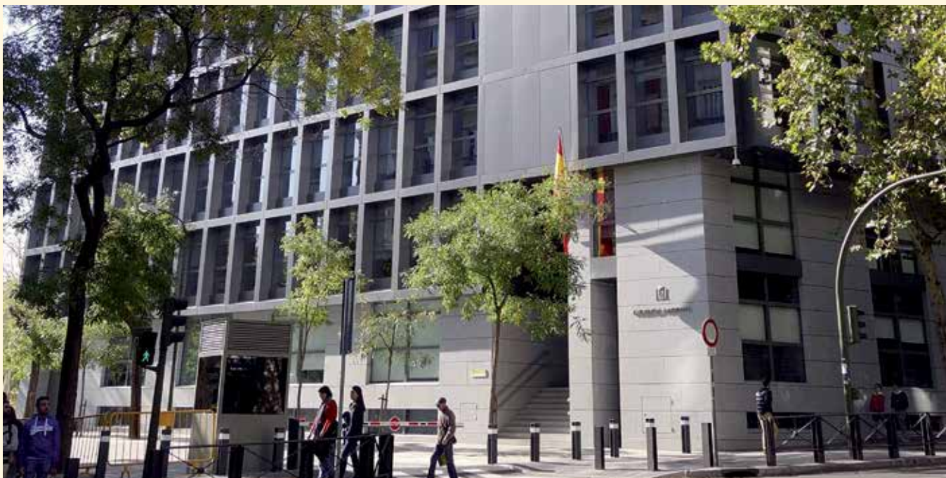
Sede de la Audiencia Nacional

Por último, la AN considera que llevar la documentación de la hoja de ruta no va en contra de los principios de necesidad o proporcionalidad. Unauto insistió en que con el registro electrónico de VTC era suficiente y que no era necesaria esa hoja de ruta, algo que se ha descartado por el magistrado.