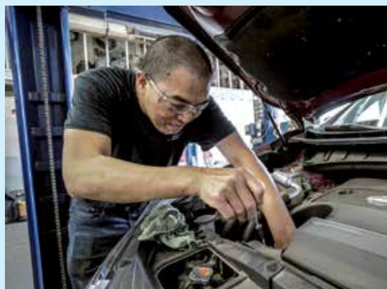
38 días sin trabajar por tener el taxi en el taller

La justicia ha dado la razón a un taxista de Gijón cuyo taxi pasó 38 días en el taller y será indemnizado con 7.180 euros para compensarle el lucro cesante. Según el fallo judicial, el tiempo de paralización del vehículo en el taller durante su reparación ha sido “muy excesivo” teniendo en cuenta los daños sufridos. El taxi entró en el taller el 3 de marzo de 2016, pero hasta 26 días no se empezó a trabajar en su reparación. Un retraso que los mecánicos justificaron por no tener una pieza que no les fue servida hasta el 29 de marzo. Sin embargo la sentencia señala que “no consta” que durante ese tiempo se hubiesen seguido realizando otros trabajos en el turismo. En base a ello, queda probado, señala la argumentación, que la paralización del taxi le ha supuesto al perjudicado una pérdida de beneficios que hubiera obtenido en condiciones normales. Un lucro cesante que debe ser satisfecho en base a los datos existentes y que, según el juez, es de 7.180 euros.