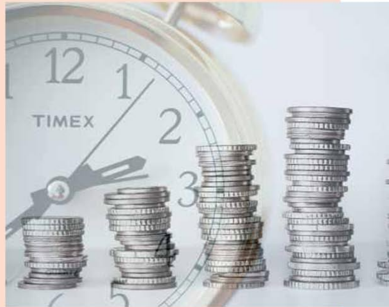
Para FEdetaxi, es importante proteger al colectivo