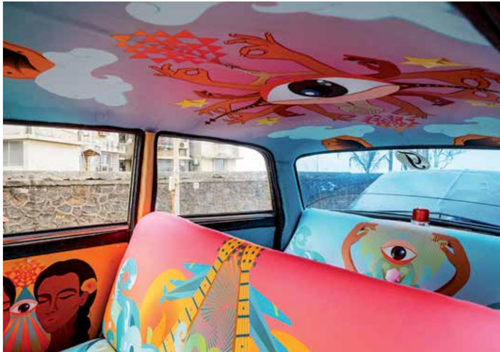
Artistas indios han usado de lienzo el interior de los taxis de Bombay.

Mientras el exterior permanece inalterado, dos de cada tres cabinas de los 43.500 taxis que hay en Bombay esconden una sor-