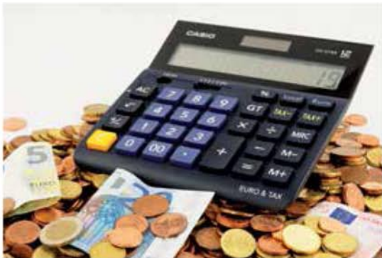
La cuota de autónomos crece un 13% en 10 años

Y aunque los datos distan todavía mucho de la distribución entre los asalariados, la presencia de la mujer se sitúa ya en una proporción 65-35 con Andalucía a la cabeza, explican desde ATA, donde la media de mujeres es superior a la media española y europea. Esta tendencia, asegura, Lorenzo Amor, presidente de ATA. Una predisposición que se ha acrecentado en los cuatro últimos años de la década 2009-2019. En este sentido, Amor se ha declarado partidario de “las políticas que ayuden a la incorporación de la mujer al tejido empresarial son buenas porque la mujer consolida la actividad que inicie más que el hombre” ante una realidad como que “las ac-