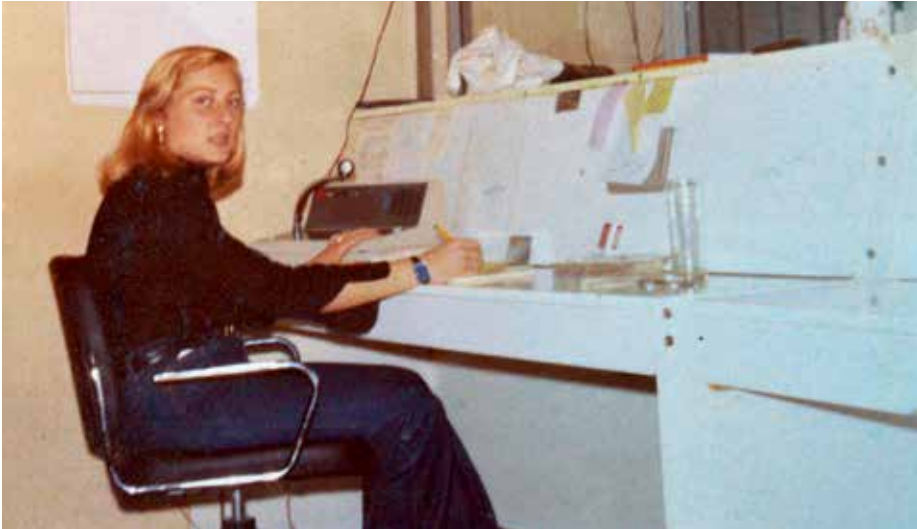
Primeros años en RTT, cuando los servicios se despachaban a mano

la cafetería que hay en Valportillo, delegación en la que ha trabajado los últimos 12 años.