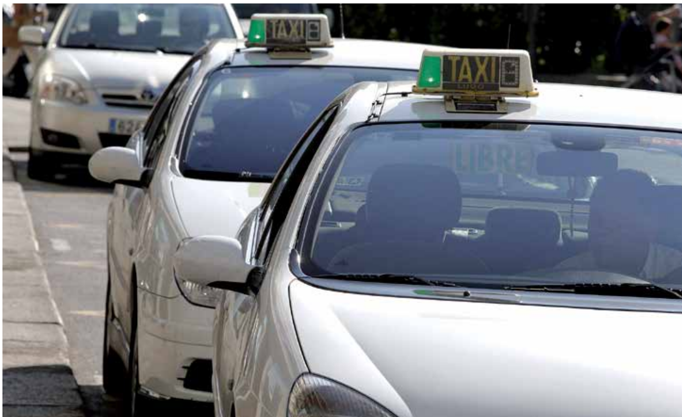
“En A Coruña el 35% de los taxis son híbridos”

M.Q.S.- Tras varias conversaciones que con la Consellería habíamos hablado de la necesidad de la transformación para hacer de las ciudades gallegas ciudades limpias y respetuosas con el medioambiente. Por ese motivo, le habíamos transmitido de la posibilidad de que los taxis de Galicia dispusieran de una ayuda para poder transformarse y hacer