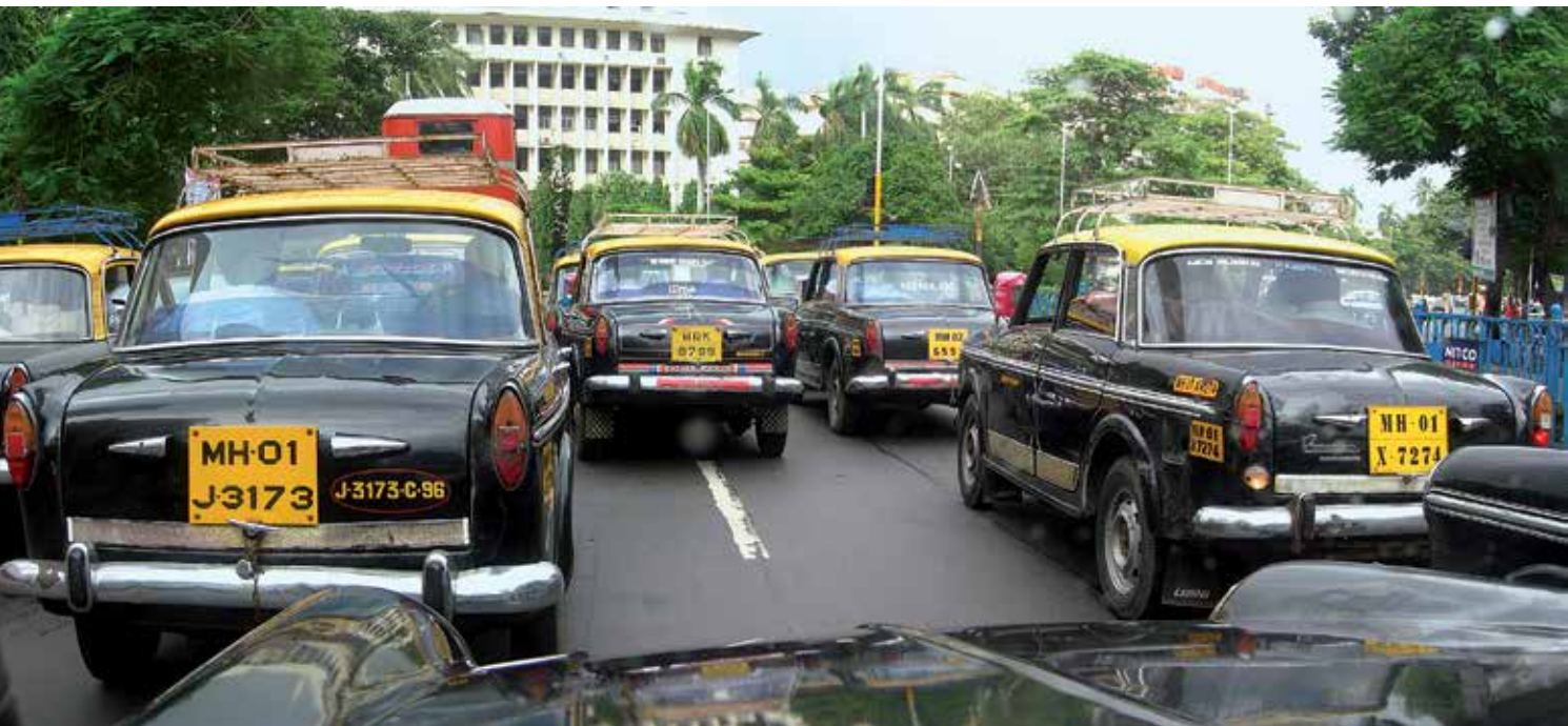
En los años '90 el Premier Padmini era el único modelo de taxi en Bombay

Junio de 2020 será el último mes en el que podrán verse por las calles de Bombay, India, el mítico taxi negro con techo amarillo Premier Padmini. Hasta 60.000 vehículos de este modelo han circulado por las calles de esta ciudad que, con el objetivo de mejorar la calidad del aire, ha cambiado la normativa de emisiones, impidiendo a estos vehículos seguir operando como taxis. Taxistas y usuarios ya dicen que lo echarán de menos.