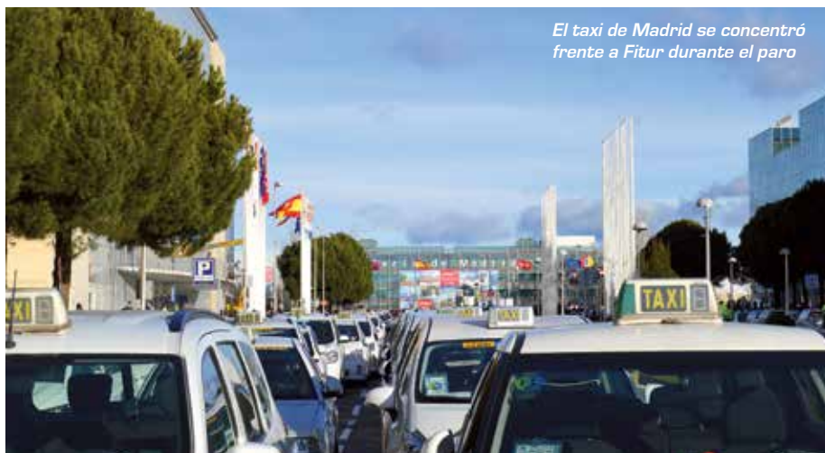
El taxi de Madrid se concentró frente a Fitur durante el paro

to se habría de liberalizar el taxi y no regularizar las VTC.