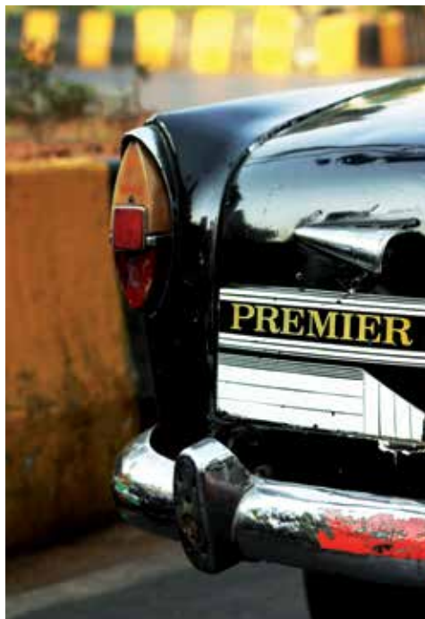
Detalle del Premier

presa en su interior. Porque aunque normalmente nadie alza la vista para observar el techo del taxi en el que se acaba de montar, si visita Bombay, por favor, no deje de hacerlo.