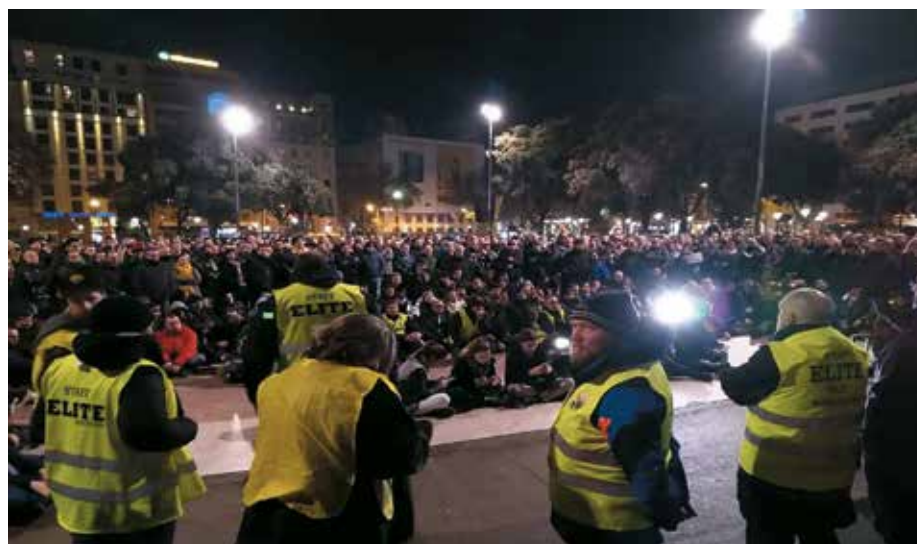
Taxistas de Barcelona y Madrid protestan durante la huelga de hace un año

T ras un histórico referéndum celebrado días antes, el 21 de enero de 2019 el sector del taxi de Madrid inició una histórica huelga para exigir a la Comunidad de Madrid que, de una vez por todas y al amparo de las competencias otorgadas por el Gobierno central, regulasen la actividad de los vehículos de arrendamiento con conductor (VTC).