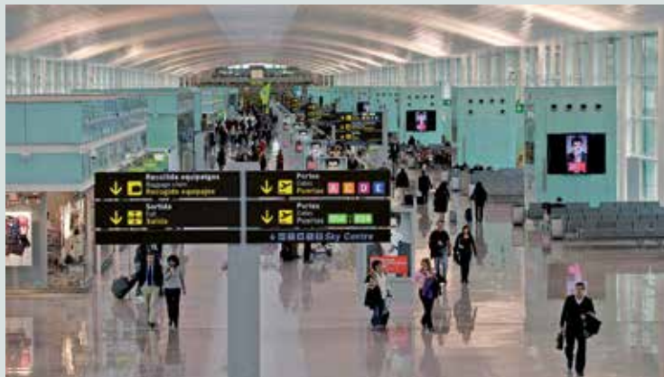
El Aeropuerto, escenario de una agresión

Un taxista de Barcelona fue agredido en el Aeropuerto del Prat por grabar a dos conductores “piratas” que presuntamente estaban captando turistas que acababan de aterrizar para ofrecerles transporte sin autorización. Según informan medios locales, el taxista agredido, con 12 años de experiencia en el sector, se encontraba en el aeropuerto para recoger a su madre que acababa de aterrizar procedente de Brasil. En ese momento, pudo observar a dos “piratas” ofreciendo servicio de taxi en la terminal, algo que está totalmente prohibido. El taxista vio movimientos sospechosos y decidió grabarlos con el teléfono móvil, siempre evitando tener problemas. “Les enseñaban a los turistas una carpeta con el logotipo oficial de los taxis y las tarifas”, lamenta ante la citada publicación el taxista agredido. Cuando uno de los conductores se dio cuenta de que el taxista estaba grabando mientras acompañaba a dos personas hasta el aparcamiento, se dio la vuelta y plantó cara al profesional del taxi. “Como me grabes te parto la cara”. Con esas palabras amenazó uno de los piratas al taxista mientras que el otro, además de insultarle, intentó coger su móvil y le agredió con un puñetazo en la cara