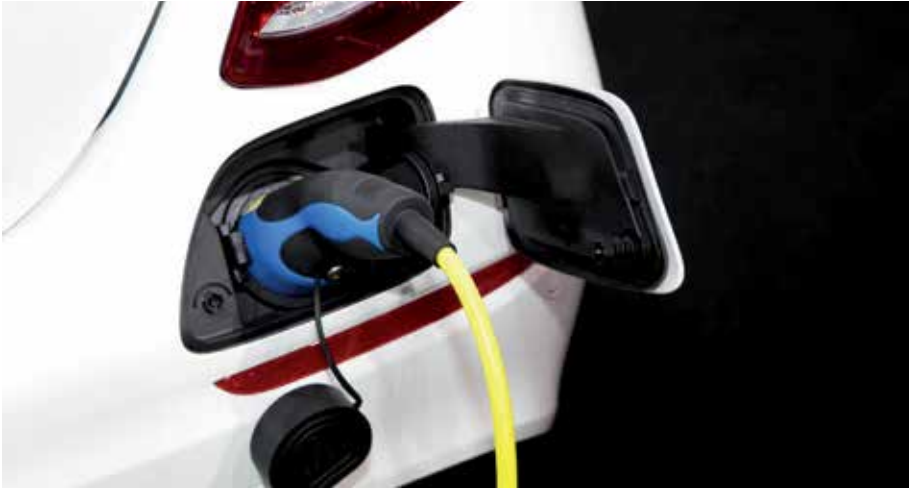
La Xunta anuncia hasta 6.000 euros de ayudas para taxis eléctricos

las ciudades cuanto menos contaminadas mejor. En alguna conversación con la Concellería lo habíamos dejado y ahora hemos conocido estas ayudas. Que no están nada mal. Son 4.000 euros para los vehículos híbridos y 6.000 para los vehículos eléctricos totales; y los 10.000 euros para los vehículos adaptados a personas con problemas de movilidad.