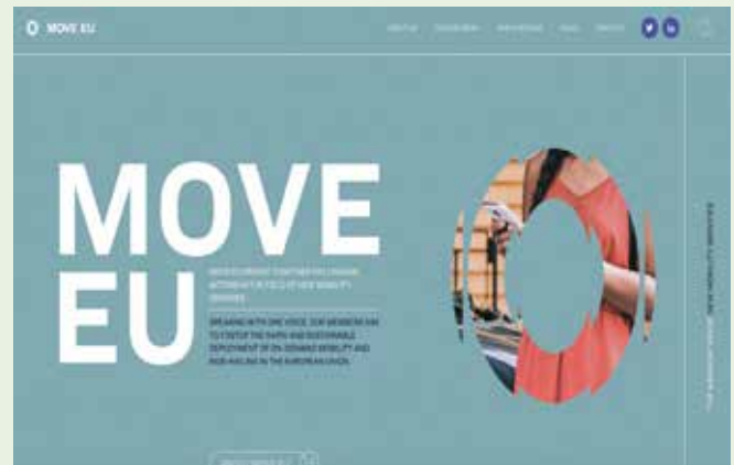
Web de la nueva asociación de plataformas de transporte multimodal

F ree Now, Uber y Bolt se han aliado en Europa y han creado la asociación Move EU “para que el sector desarrolle posiciones comunes y hable con una sola voz”. En su página web puede leerse que sus miembros “tienen como objetivo fomentar el despliegue sostenible de la movilidad bajo demanda y el transporte compartido en la Unión Europea”. Explican además que “los miembros de Move EU actúan como intermediarios en línea entre los vehículos de alquiler privado, VTCs o los taxistas y los pasajeros, emparejando de manera eficiente la oferta y la demanda”. Denuncian que los marcos legales que se aplican a estas plataformas de transporte, “difieren significativamente” creando un campo de juego “desigual”. Por lo tanto, insisten, “es crucial garantizar marcos legales flexibles que se apliquen a los servicios de movilidad de taxi y VTCs” y hacen un llamamiento a la Comisión Europea para que proponga un marco normativo armonizado y progresivo.