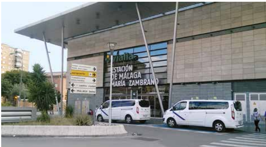
En Málaga se mantiene la regulación, aunque hay más taxis en las calles

aeropuerto, también se aumenta la oferta pasando de 80 a 103 taxis los taxis operativos. Ahora, cada vehículo podrá estar en el aeródromo una vez cada 14 días. Esta regulación en el aeropuerto también está sujeta a posibles cambios como consecuencia del aumento de la demanda.