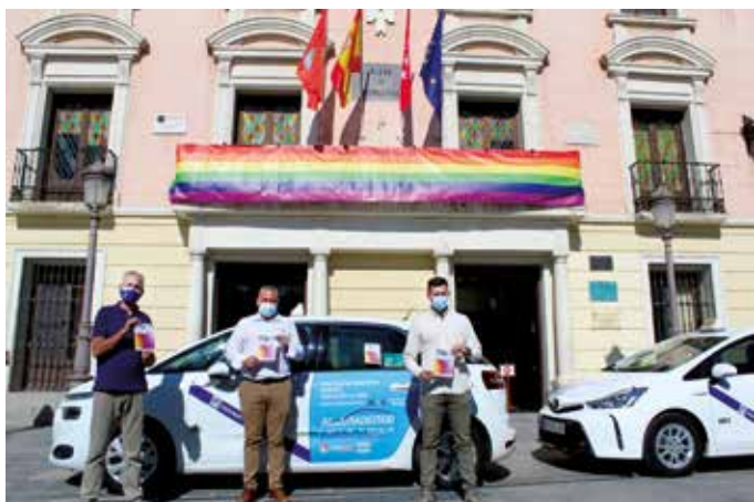
Los taxistas de Alcalá de Henares durante la presentación de la campaña

Otras ciudades, como Alcalá de Henares, también han apostado por el taxi para difundir este mensaje de tolerancia, portando en sus vehículos pegatinas del ‘Orgullo AH 21’. Sevilla, celebrando el Mes de la Diversidad Sexual con diferentes actuaciones con el objetivo de sensibilizar, visibilizar y reivindicar los derechos de las personas LGTBI, empleó al taxi como soporte de difusión.