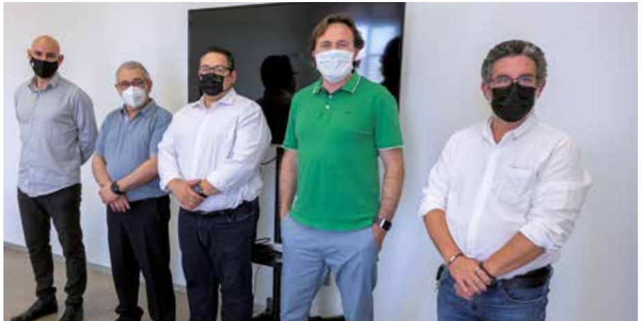
Grezzi en una reunión con los representantes del sector del taxi en Valencia

G.G.- Además del tiempo mínimo de precontratación ampliado a una hora, también hemos introducido en el borrador que no se puede realizar la captación a través de la geolocalización. El servicio que se preste debe estar efectivamente contratado con antelación suficiente y prohibir la geolocali-