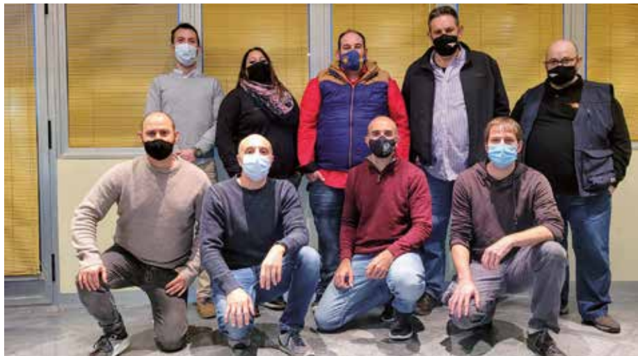
El nuevo Consejo Rector de la Cooperativa zaragozana

es quién les hace daño. ¿Cómo es la competencia con las VTCs en Zaragoza?