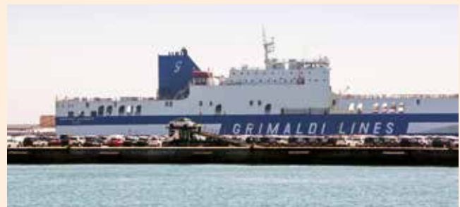
Los cruceristas solo podrán moverse en autobuses de las navieras