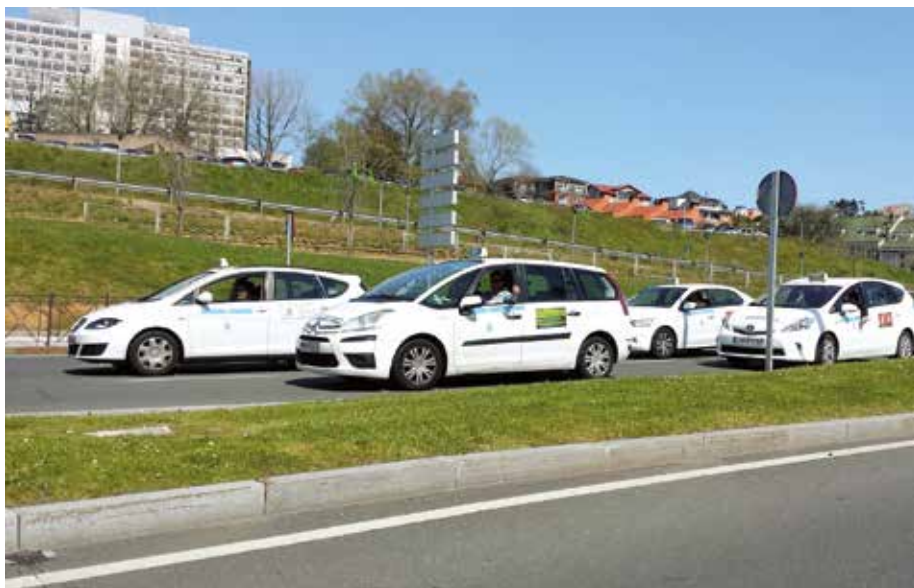
Santander vuelve a tener el 100% de su flota operativa

12,5 a 16 horas, permitiendo de esta forma la coincidencia de los turnos durante unas horas para poder atender mejor la creciente demanda.