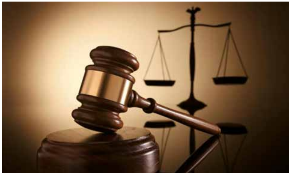
Los tribunales muestran disparidad de criterios en la precontratación de VTCs

Desde la aprobación del llamado Decreto Ábalos en 2018, diferentes Comunidades Autónomas y Ayuntamientos han establecido en sus territorios un tiempo mínimo de precontratación para los servicios de VTCs. Esos periodos han sido recurridos a los tribunales por parte la patronal y de empresas de alquiler con conductor, y las resoluciones judiciales han sido muy diversas en función del territorio donde se presentaba el recurso. La disparidad de criterios está generando una importante confusión entre las administraciones que esperan que el Tribunal Supremo sienta jurisprudencia sobre este asunto.