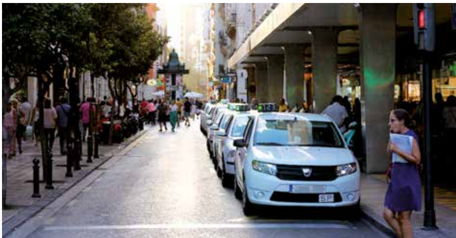
Los taxistas de Valencia han agradecido al Ayuntamiento la aprobación de esta Ordenanza

inicia un periodo de exposición pública presentarán las respectivas alegaciones.