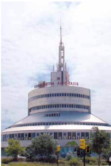
El icónico edificio de la Cooperativa, uno de los mejores ejemplos de arquitectura industrial del s.XX