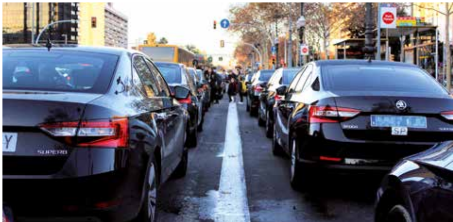
Protesta de las VTCs contra su regulación en Barcelona

Sin embargo, recientemente el Tribunal Superior de Justicia del País Vasco ha anula-