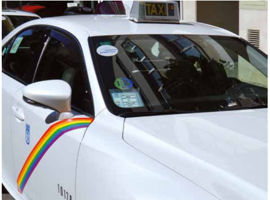
Es el segundo año que los profesionales madrileños pueden colocar la bandera arcoíris en sus taxis

Un año más, el taxi ha lucido los colores del Orgullo en sus puertas. Madrid, Sevilla o Barcelona son algunas de las ciudades donde el sector ha colaborado con diferentes asociaciones y organizaciones LGTIBQ+, demostrando así su firme compromiso con la tolerancia.