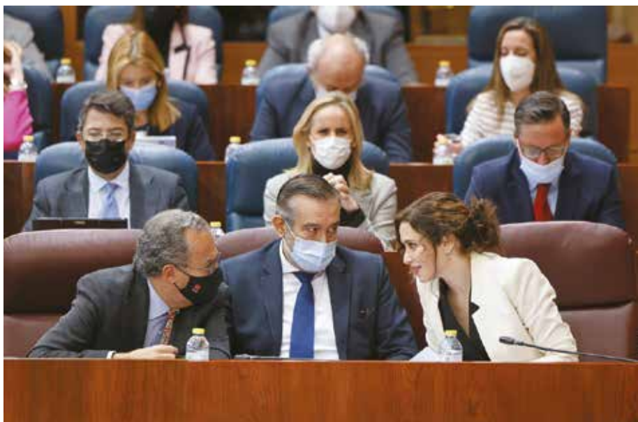
La modificación de la ley deberá ir al pleno antes de septiembre

Sin embargo, y según palabras de la pro-