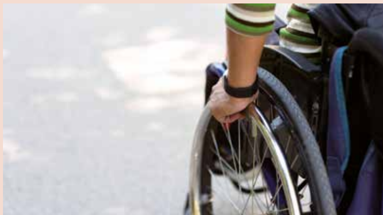
Piden a la CAM que se garantice el acceso en igualdad de condiciones

deplorable", indica Font. Famma solicita además que la regulación de VTC en la que ya trabaja el Gobierno de la Comunidad de Madrid "garantice el acceso de las personas con discapacidad o con movilidad reducida en igualdad de condiciones".