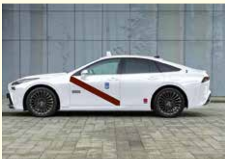
Autonomía de 650 km

El Mirai es un coche de cuatro puertas y cinco plazas que cuenta con la clasificación de CERO emisiones de la Dirección General de Tráfico. Se estima que este vehículo de pila de combustible puede alcanzar una autonomía de 650 kilómetros y la potencia de su motor puede llegar a los 182 CV, consiguiendo una aceleración de 0 a 100 Km/h en 9 segundos.