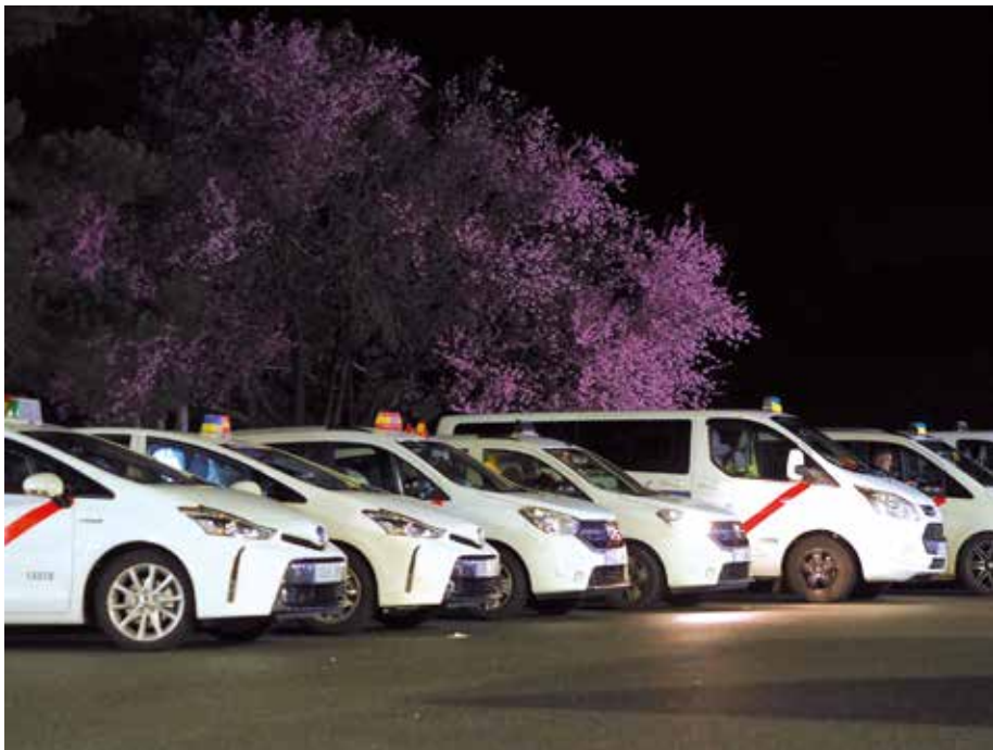
33 taxis madrileños conformaron el convoy humanitario para recoger refugiados

El pasado 11 de marzo, 66 taxistas de Madrid iniciaron una aventura solidaria que se convertiría en el viaje de sus vidas. Ese día, 33 taxis partieron desde la capital de España rumbo a la frontera de Polonia con Ucrania con 25 toneladas de ayuda humanitaria y con el objetivo de traer a nuestro país a más de un centenar de refugiados que habían tenido que abandonar sus hogares como consecuencia de la guerra iniciada por Rusia en Ucrania.