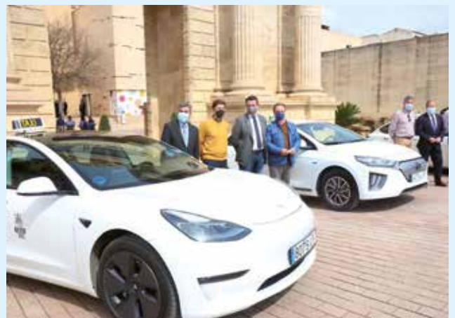
El Ayuntamiento ha otorgado una ayuda de 8.000 euros

El taxi de Córdoba ha incorporado a su flota tres vehículos completamente eléctricos. Se trata de dos modelos Tesla y un Hyundai Ioniq. Para cada uno de estos vehículos el Ayuntamiento ha otorgado una ayuda de 8.000 euros. “Queremos dotar al sector del taxi en Córdoba de los parámetros a nivel europeo que se están demandando en este tipo de transporte”, ha explicado Miguel Ángel Torrico, delegado de Seguridad del Consistorio cordobés, que reconoció que el fin de las ayudas es acentuar la movilidad eléctrica sostenible en la ciudad. Junto a estos tres coches, el Ayuntamiento también ha subvencionado un vehículo accesible a personas con movilidad reducida por un valor de 6.000 euros. Con esta ayuda, en Córdoba hay ya 31 vehículos adaptados. Por último, se han subvencionado hasta 35 taxis para la instalación de GLP (gas licuado de petróleo). Córdoba tiene ya un 20% de sus taxis propulsados con este tipo de combustible