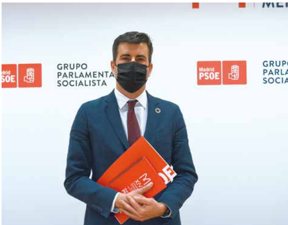
"El taxi es un sector estratégico y esencial"