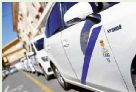
Las interurbanas son la T2, T3 y T4

E l Gobierno de Canarias ha revisará y actualizará las tarifas interurbanas, congeladas desde 2017 para compensar al sector por el alza del precio del combustible. Las tarifas interurbanas existentes en los servicios de taxi de Canarias son la T2 (aquella que se aplica en servicios interurbanos con origen y destino en el punto de partida con o sin tiempo de espera), la T3 (aquella que se aplica a servicios que tengan su origen en el municipio al que corresponda la licencia que tengan su destino fuera de las zonas urbanas o en otro municipio) y la T4 (aquella que se aplica desde los distintos municipios hasta los aeropuertos y de estos a los distintos municipios).