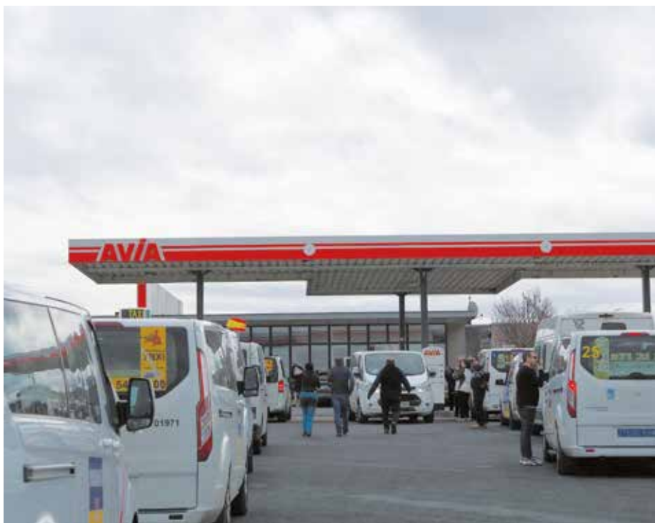
Imagen de una de las paradas para repostar durante el viaje

muy difícil de asimilar. Yo me salí del pabellón porque era muy duro y quedé tocada”, afirma aún con un nudo en la garganta.