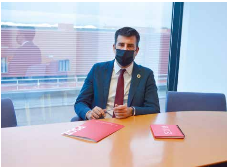
“PP y Vox decidirán la forma en la que se aprobará este proyecto”

Durante este tiempo, las administraciones competentes, incluidos los ayuntamientos, no han hecho nada al respecto. No han regulado nada y es algo que tenían que haber definido antes y no dejarlo para el último momento. Han mantenido el estado de las cosas y se han despreocupado absolutamente cuando insisto en que es un