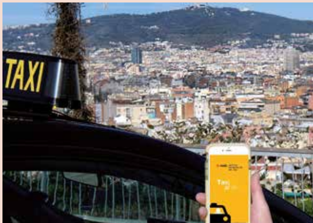
La comunicación de los datos es obligatoria

Recuerdan desde el IMET que esta comunicación es "obligatoria" para todos los conductores de taxi, ya sean titulares, familiares o asalariados, independientemente de que anteriormente ya hayan facilitado esta misma información al Institut. Además, tal y como explican, a partir del día 1 de junio la comunicación de estos datos será requisito indispensable para pasar favorablemente la revisión metropolitana.