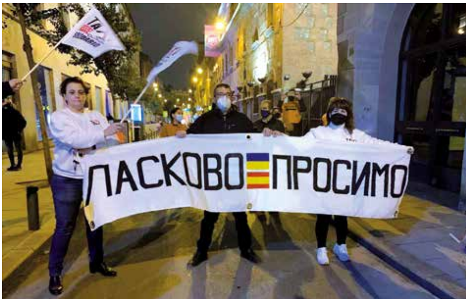
Taxistas madrileños esperaron hasta la madrugada para recibir a los compañeros del convoy

Días antes, Luis había decidido participar consciente de lo que estaba pasando. “Decido participar porque sentía la necesidad de hacer algo. Acoger, por mis circunstancias, no puedo y entonces vi que el viaje sí que lo podía hacer. No es más que un pequeño esfuerzo, lo hablé con mi mujer y sabía que no tenía ni que explicárselo porque ella sabía que era lo que buscaba”, explica. “Me puse en contacto con Federación y finalmente, el día de antes de marchar el convoy, me avisaron de que podía formar parte como conductor porque uno de los apuntados no podía. Me puse a saltar de alegría como un niño”, indica este taxista.