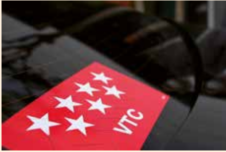
Madrid cuenta a 1 de marzo de 2022 con 8.362 autorizaciones

Por primera vez en meses, el número de autorizaciones de vehículos de alquiler con conductor (VTC) desciende ligeramente. Según datos aportados por el Ministerio de Transportes, España cuenta actualmente con 17.974 VTCs frente a las 18.094 autorizaciones que aparecían registradas a comienzos de febrero. En total, 120 VTCs menos que rompen con la tendencia al alza que mantenía la flota de este tipo de vehículos durante los últimos meses en España, especialmente en las grandes ciudades.