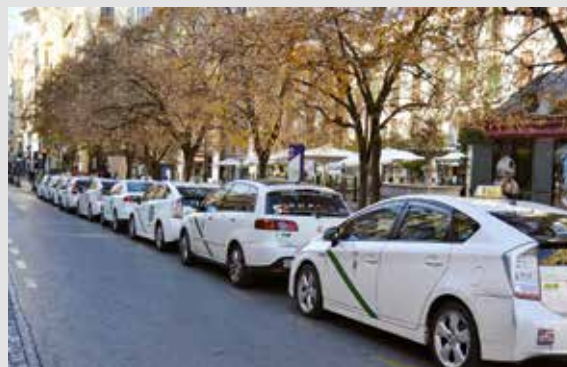
Se incluirá el precio cerrado o el taxi compartido

Marifrán Carazo, alcaldesa de Granada, se reunió este lunes con la Asociación Gremial Provincial del Taxi para informar sobre las intenciones del equipo de gobierno local de iniciar los trámites para modificar la Ordenanza del Taxi. El texto regulador del taxi granadino además debe adaptarse el decreto 84/2021 que modifica el Reglamento del Transporte de Viajeros en Automóviles de Turismo, o también llamado decreto Carazo, que fue impulsado por la actual alcaldesa de Granada en su papel de consejera de la Junta de Andalucía.