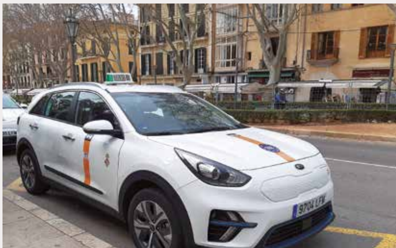
En Baleares también se prorrogará un año

La medida, que responde a una demanda del sector del taxi, tendrá una duración de un año y no está previsto que su vigencia se prolongue en el futuro. El decreto entrará en vigor una vez que se publique en el Boletín Oficial de Baleares.