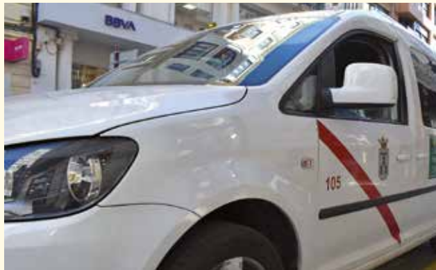
El importe total de las ayudas es de 33.000 euros

El Ayuntamiento de Albacete, por medio de su Comisión de Movilidad, tiene previsto aprobar la convocatoria de subvenciones para la compra de taxis adaptados a personas con movilidad reducida. El objetivo de esta medida no es otro que "mejorar y ampliar los medios de transportes existentes en beneficio de este colectivo".