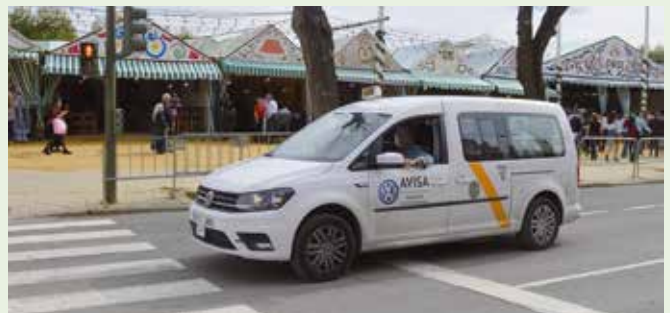
La capital andaluza actualmente tiene más eurotaxis que ese 5%

que ese 5% y por ese motivo abre este tipo de convocatorias. No obstante, llama la atención ver cómo en Sevilla están intentando adelgazar la flota de taxis adaptados a personas con movilidad reducida mientras que, en otros lugares, como por ejemplo en Pamplona, reducen el precio de salida de estas licencias para que algún taxista se haga cargo de ella.