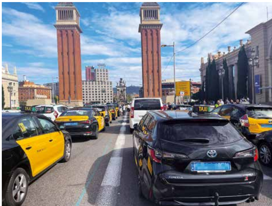
Los taxistas de Barcelona movilizándose contra la resolución de la ACCO

Desde Élite sostienen que la resolución de la ACCO vulnera los derechos y libertades fundamentales de los taxistas asociados y/o representados por la organización, en concreto el Derecho a la libertad de expresión