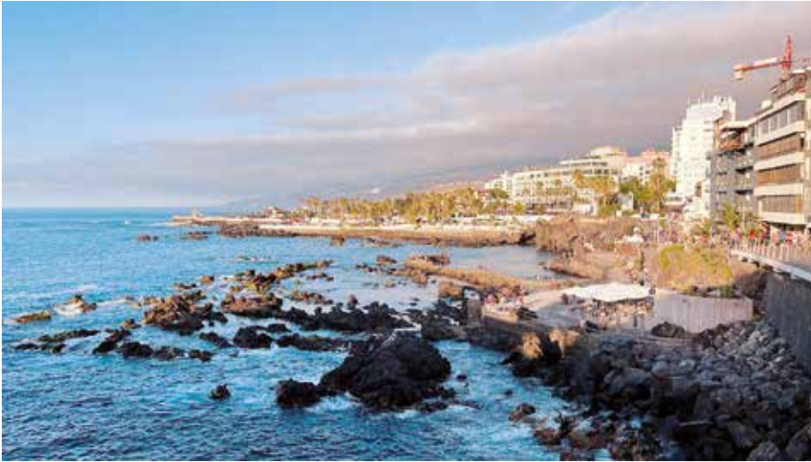
Puerto de la Cruz cuenta con 200 taxis en la actualidad

tes, llevamos demasiados años aguantando esta situación.