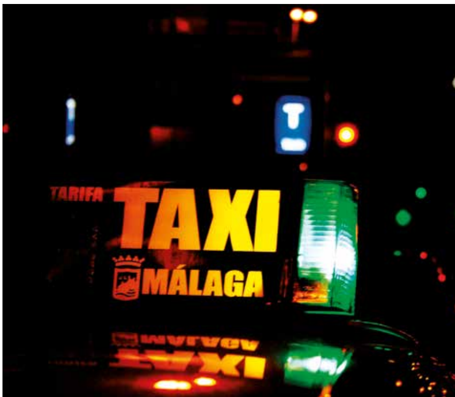
Báez cree que el taxi está recuperando a los usuarios por su fiabilidad y seguridad

solo con la escritura, sino con poder desplegar otras inquietudes culturales.