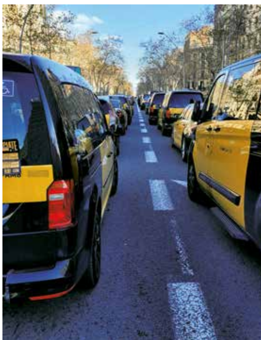
Además de en las calles, Élite Taxi también "batallará" contra la ACCO en los juzgados