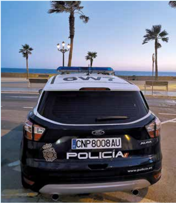
Desde Málaga advierten de que estas prácticas pueden reproducirse en otros lugares

La Policía Nacional en Málaga, por medio de su Delegación Provincial de Participación Ciudadana, ha mandado un mensaje de alerta sobre el colectivo del taxi con el objetivo de que estén prevenidos ante las nuevas formas de obrar de unos ladrones que han cometido ya varios delitos de hurto sobre taxistas de la capital de la Costa del Sol.