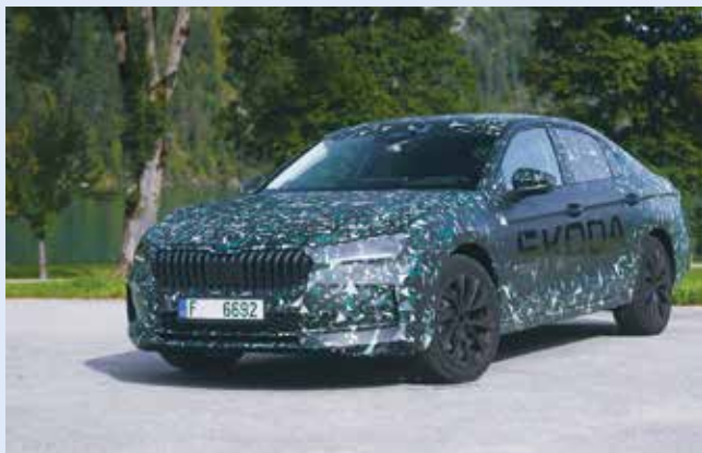
El nuevo modelo tendrá una versión híbrida

Por otro lado, se han optimizado las tomas de aire y se ha realizado un trabajo más minucioso en la zona de los ocupantes y los retrovisores exteriores para mejorar la aerodinámica.