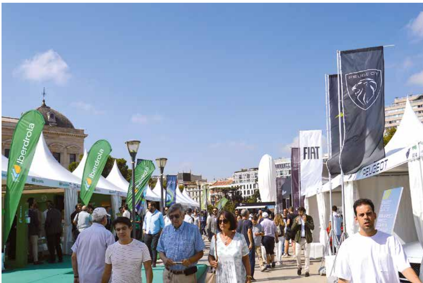
La Feria del Vehículo Eléctrico se celebró en Madrid el 8,9 y 10 de septiembre

Aunque según datos de Global Electric Vehicle Outlook 2022 de la Agencia Internacional de Energía (AIE), en 2022 se vendieron 10 millones de vehículos eléctricos y se espera que en 2023 se espera que alcancen los 14 millones de unidades vendidas, es decir un 35% de crecimiento, en España el sector continúa sin despegar como se espera. Según los datos de la Asociación española de Fabricantes de Automóviles y Camiones, ANFAC, en 2022 las ventas de eléctricos supusieron un 9% del total, situándose en Madrid la mayor parte de las mismas.