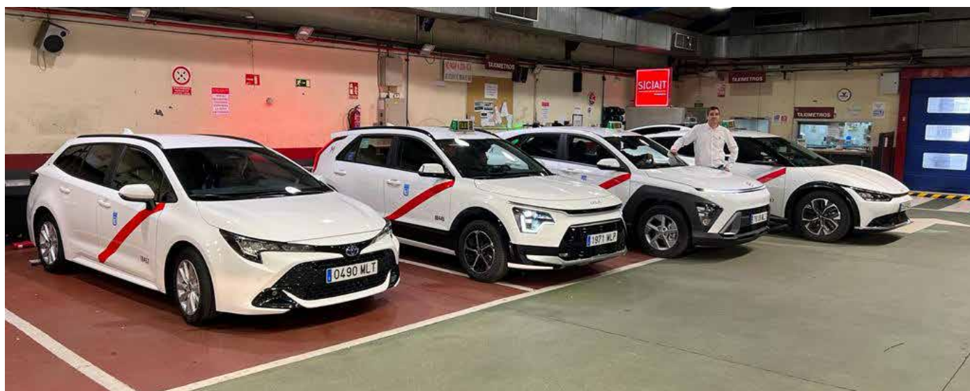
Blanco con algunos vehículos homologados por SCAT

J.B.- Hoy en día la sustitución de un vehículo requiere en la mayoría de casos que se tenga que instalar un taxímetro de espejo. Además, obligatoriamente debe dotarse al vehículo de un sistema de Bucle Magnético. En ocasiones el titular también quiere o debe cambiar el módulo luminoso o capilla. Si además opta por un modelo no homologado, hay que instalar la manguera de señal y obtener un certificado de conformidad de un laboratorio, para legalizar la instalación. Al final la factura de todo eso puede estar en una horquilla de entre 1.500 y 1.900€. Aquí, los socios que lo deseen pueden pagar