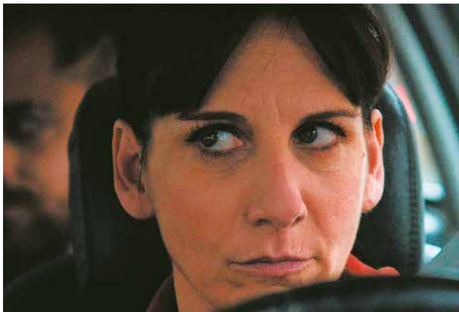
Malena Alterio conduciendo un taxi dando vida a Lucía en Que nadie duerma

“El taxi forma parte de mi día a día”. Así responde Malena Alterio cuando se le pregunta por un sector, el del taxi, que valora profundamente y al que ha tenido la oportunidad de conocer en profundidad preparándose para dar vida a Lucía, la protagonista de Que nadie duerma . Un papel que le ha proporcionado su primera nominación a los Goya como actriz protagonista y en el interpreta a una mujer que encuentra en el taxi una oportunidad laboral que le traerá muchas aventuras circulando por las calles de Madrid.