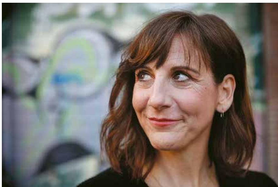
“He tenido malas experiencias con otras alternativas al taxi”