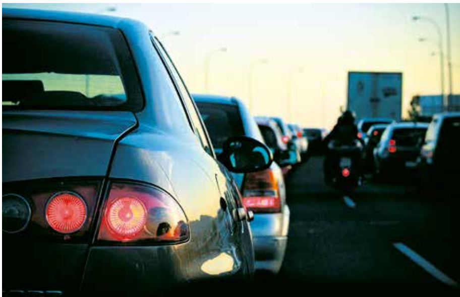
El tráfico, uno de los principales problemas para el taxi mallorquín

servicios previamente contratados, hacen captación en la vía pública, paran en las paradas cuando tienen la oportunidad. Es decir, incumplen con mucha asiduidad y no hay un trabajo de campo sobre la página de control del Ministerio de Transportes en sancionar todas las cosas que creo que, de oficio, a través de esa página, se podían detectar.