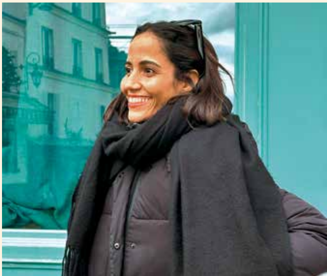
Tesh Sidi, diputada de Sumar en el Congreso de los Diputados

La diputada de Más Madrid en el Congreso, Tesh Sidi, presentó el pasado 30 de septiembre una proposición no de ley para limitar los precios de las plataformas que operan con vehículos de alquiler con conductor (VTC). Sidi, integrada dentro del grupo Sumar, puso como ejemplo en su propuesta la forma en que las VTC incrementaron por cinco sus tarifas habituales durante el festival Mad Cool de julio de 2023.